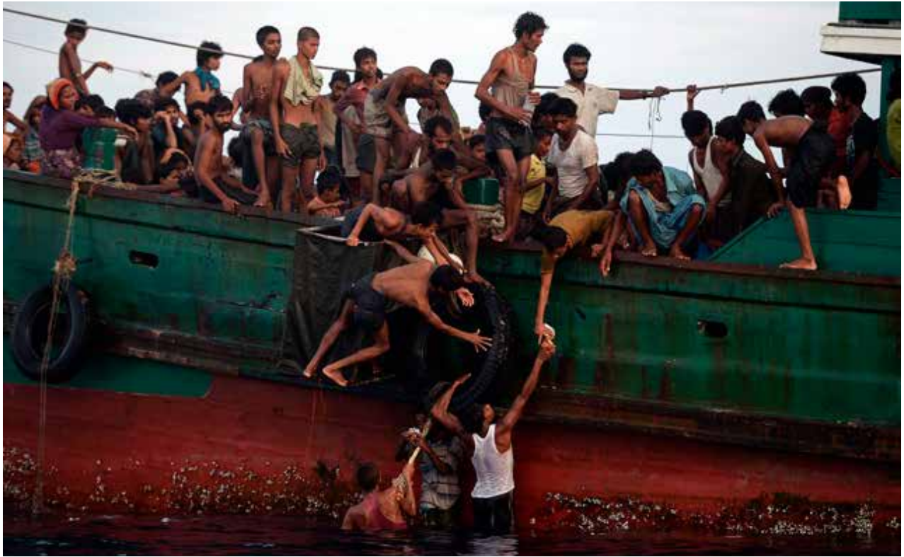
TUSINDVIS AF ROHINGYAER ER FLYGTET FRA MYANMAR, SIDEN FORFØLGELSEN AF DEN MUSLIMSKE MINORITET TOG FART I 2012. I MAJ I ÅR FIK ROHINGYAERNE FOR EN STUND VERDENS OPMÆRKSOMHED, DA BÅDFLYGTNINGE DREV RUNDT I FARVANDET UD FOR MALAYSIA OG INDONESIAEN.

børn, og at de til sidst vil udgøre et flertal i Myanmar.